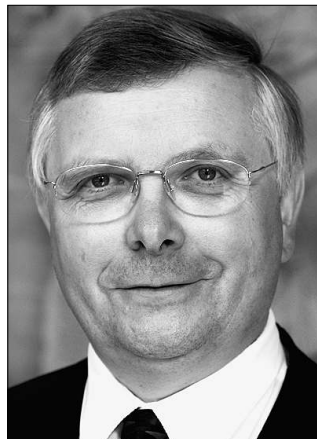
Axel Noack, 56, Bischof in Magdeburg