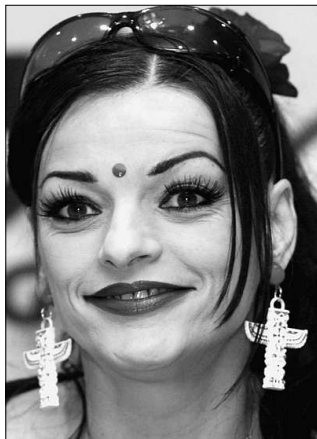
Nina Hagen, 51, Sängerin