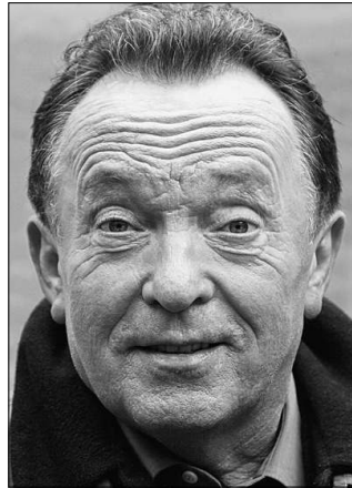
Peter Sodann, 69, „Tatort“-Kommissar