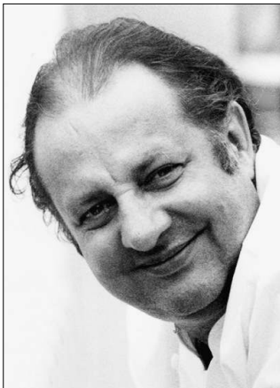
Vincent Klink, 56, Star- und ARD-Fernsehkoch

Widerstand ist möglich: Warum diese Schauspieler, Unternehmer und Musiker den Dreckstrom der vier großen Energiekonzerne boykottieren und auf Ökostrom umgestiegen sind SEITE 3